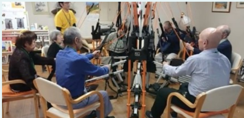
③ ボディスパイダー